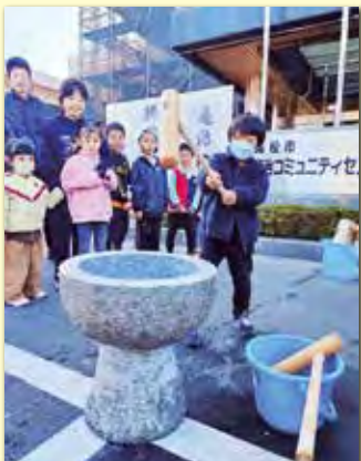
杵で餅つき、初めてです