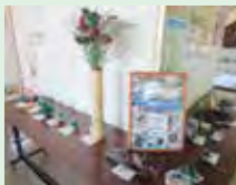
力作ぞろいの作品ばかり

庵治中学校1年生が、ふるさとの「良さ」発見ツアーを行いました。江の浜の清掃で集めた海ごみ・流木・貝殻、町内で見つけた松かさなどの自然のものを使い、ふるさとや家族、なかまへ心を込めたオブジェを作りました。ある生徒が作った流木や葉っぱを組み合わせた船は、お父さんの船に乗せてもらいたいという思いからのものです。ふるさと庵治への思いや、大切な人を思い浮かべながらそれぞれに作った作品は、とても廃材とは思えない力作ばかりでした。年末から年始にかけて、コミュニティセンターで展示された作品を見た多くの方々は「発想が素晴らしく、こんなきれいなものができるのは感心しました」と大好評でした。