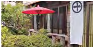
瀬戸音十庵(せとねじゅうあん)のお庭

その後はバタバタと仙台の家の売却手続きを進めて引っ越してきた次第です。おかげさまで北村墓地にお墓を建てることができ、10年間仙台のお寺に預けっぱなしだった