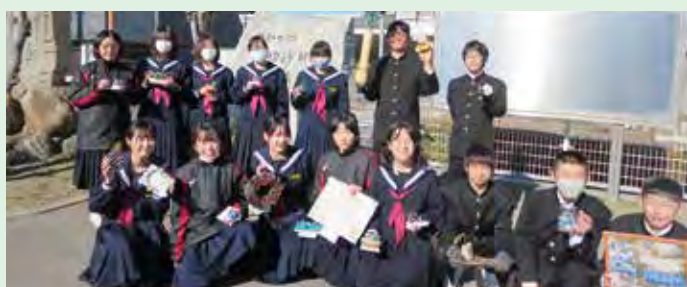
思いを込めた作品を持って