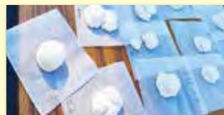
ユニークな鏡餅がいっぱい

この餅つき大会は、庵治の良さを再発見しようと、コミュニティ協議会と企画委員会が中心となり実施したものです。庵治石の臼で、庵治産の