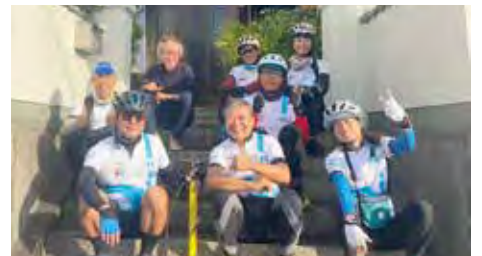
四国一周自転車旅に来られた台湾人グループのお客様と記念撮影

さて、こちらに来てから始めてみたゲストハウスですが、でたらめな英語を苦使(笑)しながらも、7年間で30か国以上の外国のお客様をお迎えすることが出来ました。さらに、オランダ、アメリカ、韓国、中国、台湾には、再び来てくれたリピーターの方もおられます。この穏やかな海辺の町が世界中の人々から愛されているのです。もちろん、私自身もこの自然豊かな地をとても気に入っています。