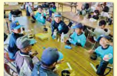
うまい!! ペロリ5個目