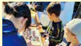
トッピング…何がいいかな～

当日は、餅つき同好会の方の実演の後、子ども用の杵を使い餅つきに挑戦し、つきあがった餅で一人一人が鏡餅作りを体験しました。その後、庵治産のチリメン・干しエビ・佃煮や、庵治産ではありませんが、チョコレート・チーズ・海苔・あんこ・きなこ・ペビースターラーメン・干しブドウ・ラムネなどを自由にトッピングし、楽しくいただきました。