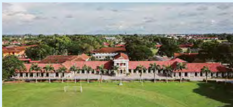
私の母校の中高等学校