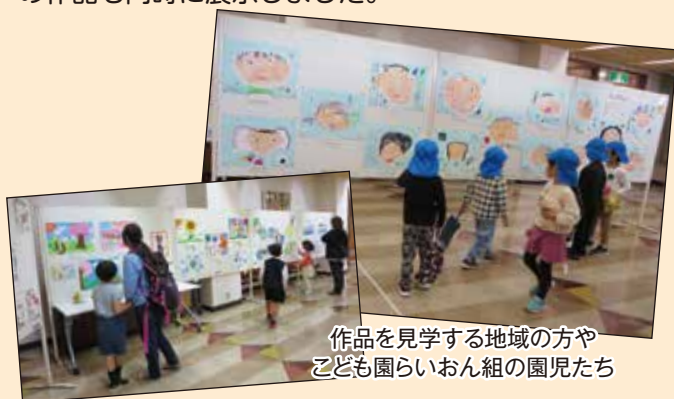
作品を見学する地域の方や こども園らいおん組の園児たち