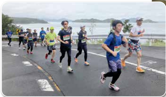
多島美を堪能しながら、タイムにとらわれず思い思いに走れる庵治半島のコースは、ランナーにとっても優しいものでした。