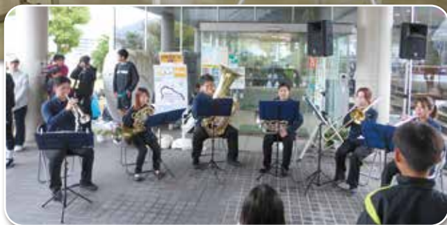
花を添えた高松市役所吹奏楽団の演奏