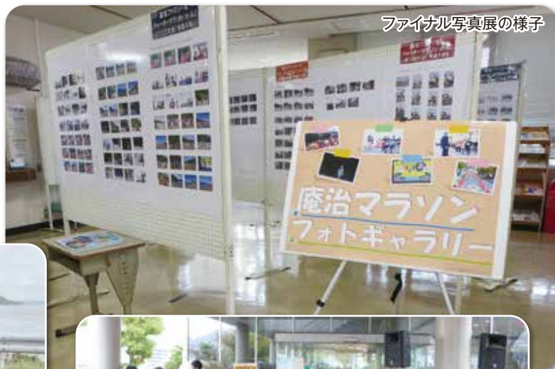
ファイナル写真展の様子