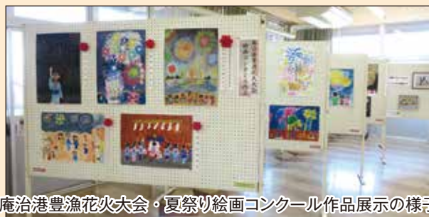
庵治港豊漁花火大会・夏祭り絵画コンクール作品展示の様子