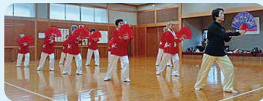
上級生の練習風景▶