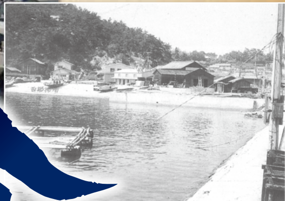
1965年(昭和40年)頃の江の浦海岸 現在埋立ができて砂浜がなくなった。

新型コロナ禍が収まった後の2025年は、神事のみが執り行われました。近年、懸念される担ぎ手などの少子高齢化や人口減少は否めない事実ですが、340年余り続いてきた、あの勇壮な「あばれ段尻」の次世代への継承を切に望みます。