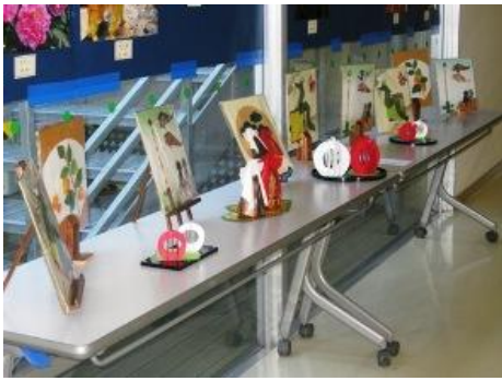
女性教室作品コミセン講座