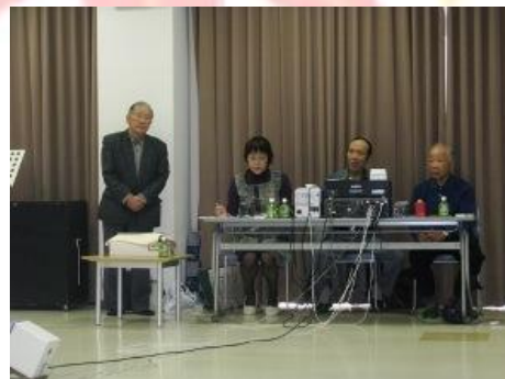
司会・音響の皆様