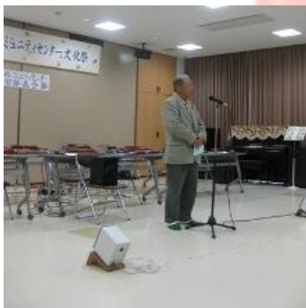
開会あいさつ(村井会長)