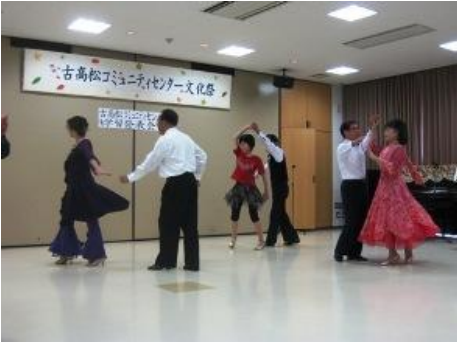
ソーシャルダンス