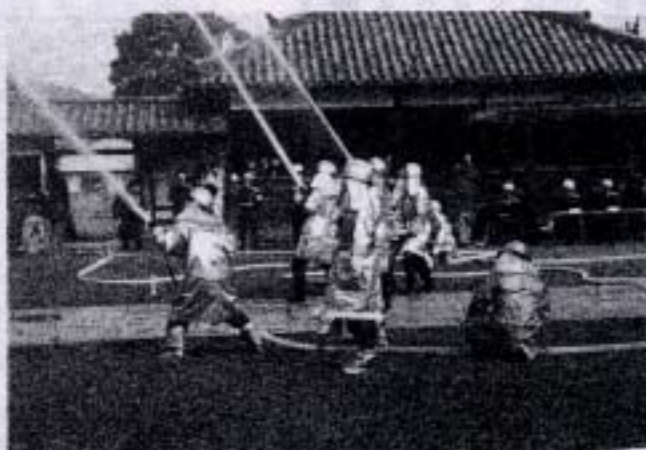
多家良分団による本堂への放水訓練