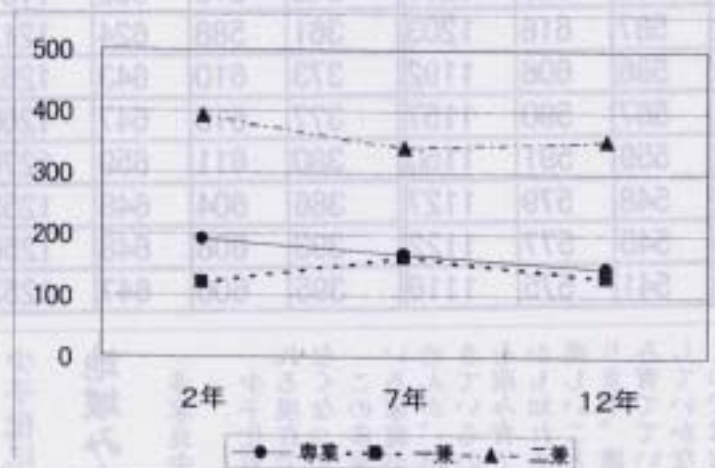
専業、兼業の内訳グラフ