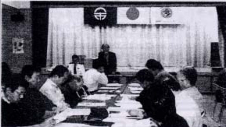
10月16日に行われた地安会設立集会の模様

どうぞ今年も災害のない、明るく楽しい町でありませう役員一同尽力いたしますので、地域の皆様もより積極的な参加をお願いします。