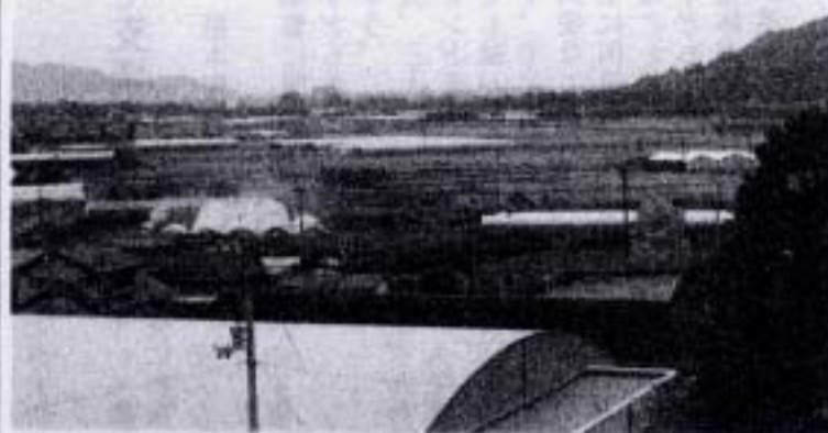
大匠寺より小松島方面を望む

農家数減る一方 全体的に見て農家数は減少する一方です。しかし、平成二年から七年にかけて一兼農家が増えていきます。これは、二種兼業農家の農業収入が増えたのではないかと推測されます。この時期バブル景気の余波がまだ残っていてハウスミカンなどの施設ものが高単価で売れていました。栽培技術も浸透し販路も安定してました。この頃は施設がまだ増えている時期でした。それを裏付けるものとして畑地が増えていきます。しかし、その後バブルがはじけ不景気の波が押し寄せてくると状況は一変します。十二年にかけ て、一兼兼業農家が激減し、二種兼業へと元に戻ります。 地域を守る農業 都市部では景気は回復傾向と言われていますが、地方、特に農業を取り巻く環境は益々悪くなる一方の感があります。しかし、農業は産業としてだけでなく、地域を守る様々な役割を果たしています。この農業を何とか守りたい。農家数を増やすには、先に述べた数字が示しているように農業所得を増やすしかないでしょう。 誰もがみんな嘆いている「なんか儲かるもんないか」それがわかれば苦労はない。