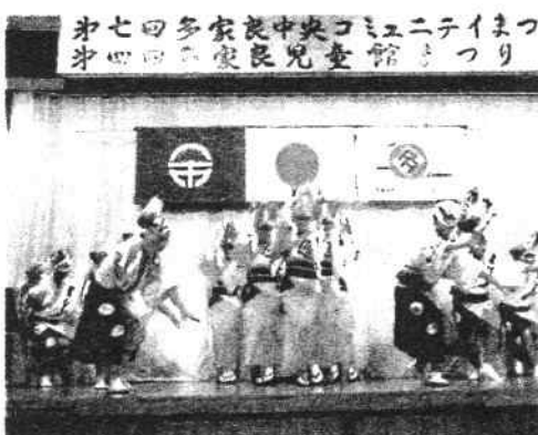
ついでにニミコ中央児童会多家良中央コミュニティより

鳴り物は、勝浦川の清流のごとく、ゆったりとした中にも凛としたスローテンポを基調に、踊り子は勿論観ている人までもが、心も身体も弾むようなお囃子を目指して日々練習に励んでいます。正調を大切に守りながらも、シンプルでオリジナリティなテンポにも益々磨きをかけていきたいと考えています。