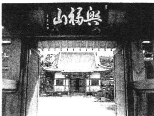
◇大匠寺（曹洞宗）の歴史をた

◇大匠寺の小高い山の上に登ると多家良の町が一望できる。遠く東の方を見れば日ノ峰山、小松島の町並み、後ろには中津峰の山々が連なる。境内の真下には宮井小学校があり、にぎやかな子供たちの声が聞こえてくる。鳥や虫の声も響き、静かな佇まいの中にありながら温かな感じが漂ってくる。山門を入ると、正面に見えるのが本堂、その横に庫裏。平成十六年に移転してきて、ようやく庭も落ち着いてきた感じである。山門の両脇には、寄進された蜂須賀桜が植えられている。